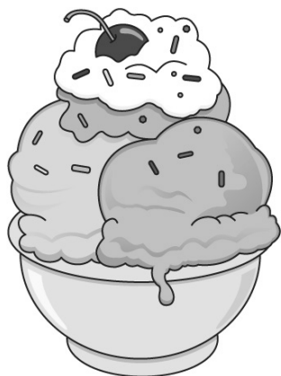
גלידה / איס