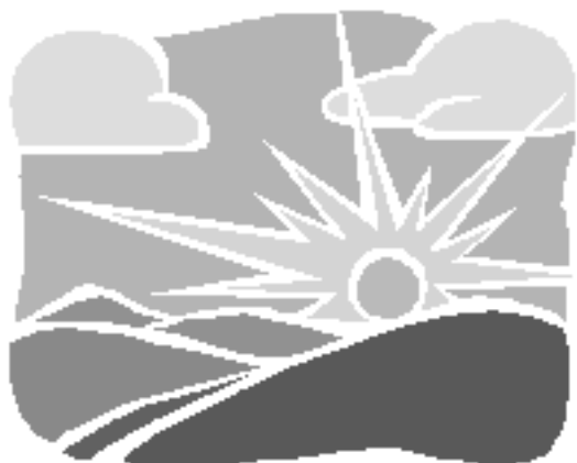
פֶּבּוּקֵר עֵא רַחוּק